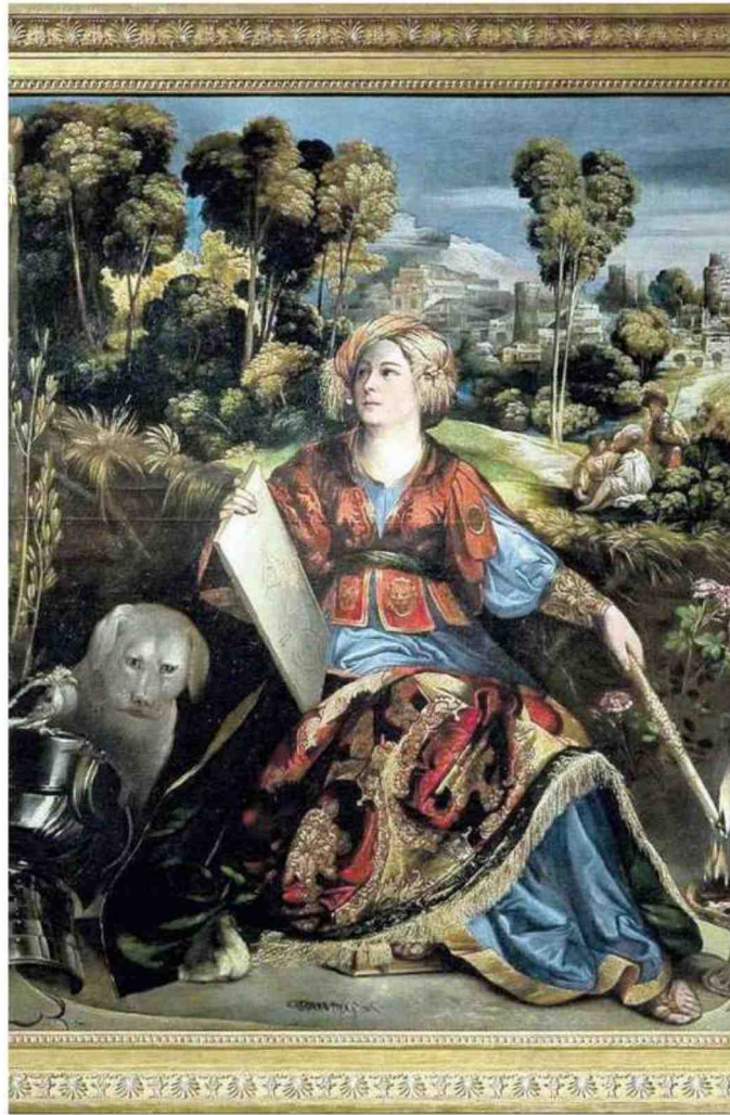
Qui sopra, "Melissa" nella mostra "Dosso Dossi. Il fregio di Enea". A destra in alto il Tempio di Livia e sotto "Vita Dulcis" di Vezzoli